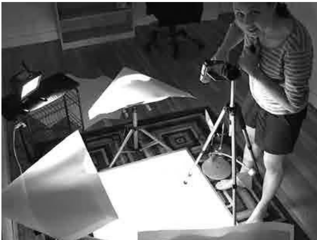
Сати в нашей второй студии, лето 2007 года

В апреле мы разместили его на YouTube, и ролик сразу стал хитом. В первый день его просмотрели десятки тысяч раз, мы получили массу электронных писем, комментариев и отзывов на нашу работу в блоге. Люди призывали нас продолжать делать видеоролики. Это был один из лучших дней в моей жизни. Наше объяснение завоевало такую популярность, потому что помогло людям понять, что такое канал RSS, позволило посмотреть на проблему с иной точки зрения.